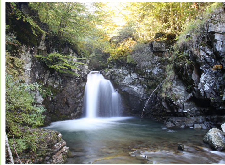
Cascata I RIOO

Seguendo una stretta mulattiera arriviamo alla cascata della Cascadoora e, proseguendo alla località Nespolo , alla confluenza del Rio Valdarno con il Rio Fontanacce, riattraversiamo il Rio Valdarno e, seguendo la strada vicinale