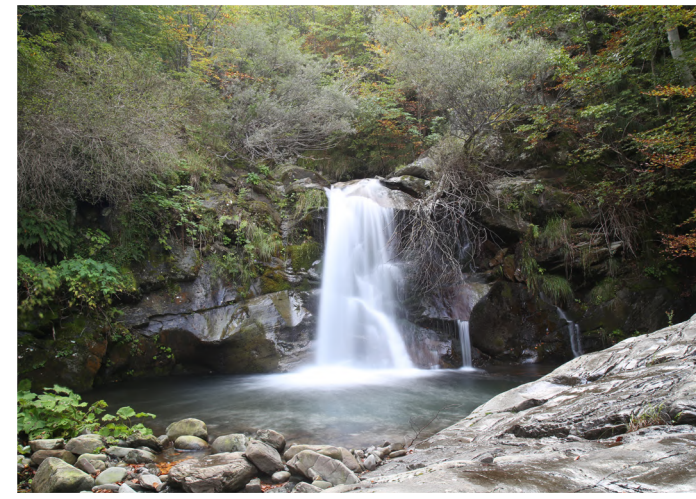
Cascata LA BANDITA

e del Rio Fontanacce (vedi i toponimi, Sega dei Rioo, Sega di Sopra e Sega di Sotto, detta anche dei Milanesi): legna da ardere, carbone e carbonella ricavati dalla frasca di faggio venivano ammassati all'imposto del Ponte di S. Anna. Questi sentieri erano usati anche per trasportare materiale ferroso proveniente dalla vicina Toscana per essere poi lavorato nelle "Fabbriche del ferro" di Casa dell'Alda e del Nespolo alla confluenza del Rio Valdarno con il Rio Fontanacce. Lungo il sentiero troviamo fonti per potersi approvvigionare di acqua: Fonte dei Rioo, Fonte di Montalto e la Fonte delle Borracce .