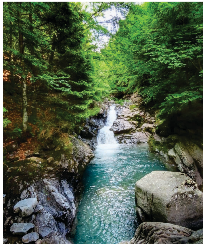
Pozzo del PISANO

Il sentiero, dopo una breve salita, diventa pianeggiante per quasi 4 km; attraversa il Rio dell'Acero , il Fosso di