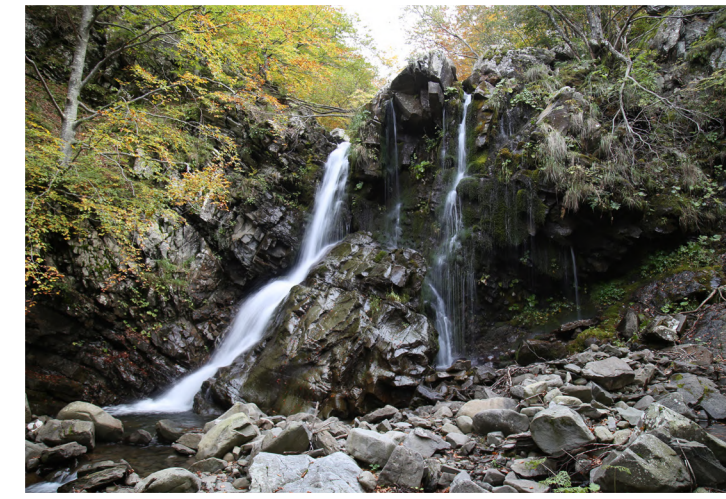
Cascata di SASSORSO

e del Rio Fontanacce (vedi i toponimi, Sega dei Rioo, Sega di Sopra e Sega di Sotto, detta anche dei Milanesi): legna da ardere, carbone e carbonella ricavati dalla frasca di faggio venivano ammassati all'imposto del Ponte di S. Anna. Questi sentieri erano usati anche per trasportare materiale ferroso proveniente dalla vicina Toscana per essere poi lavorato nelle "Fabbriche del ferro" di Casa dell'Alda e del Nespolo alla confluenza del Rio Valdarno con il Rio Fontanacce. Lungo il sentiero troviamo fonti per potersi approvvigionare di acqua: Fonte dei Rioo, Fonte di Montalto e la Fonte delle Borracce .