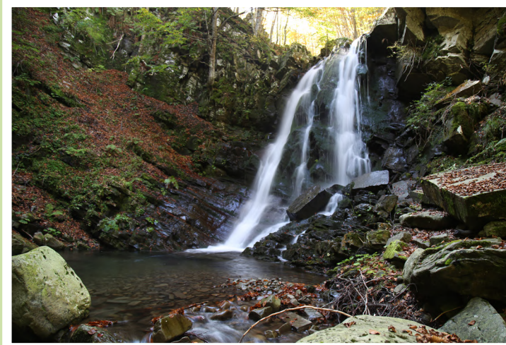
Cascata del TERZINO

Dal XVI secolo questi sentieri erano percorsi dai trasportatori di legname semilavorato dalle segherie del Rio Valdarno